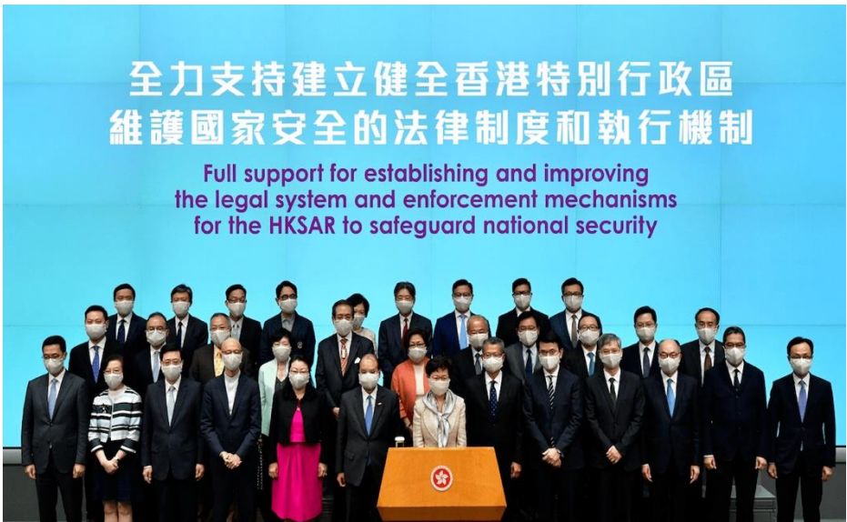
(圖 2) 全國人大常委會通過《港區國安法》，保持香港特別行政區的繁榮和穩定，以及保障特區居民的合法權益。