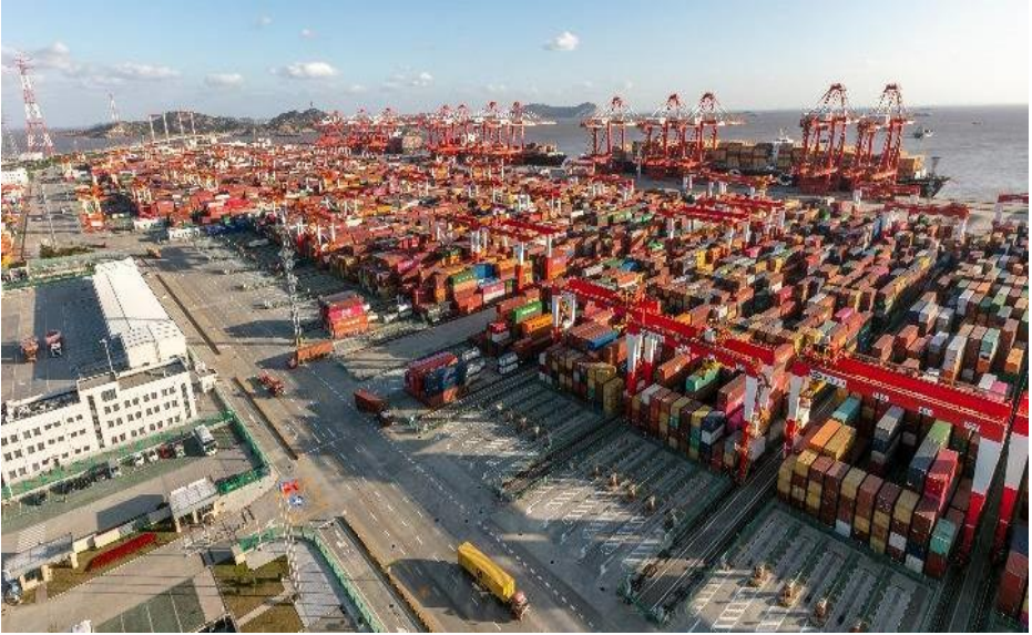
(圖 7) 洋山特殊綜合保稅區在上海揭牌，進一步打造更具國際市場影響力和競爭力的特殊經濟功能區。