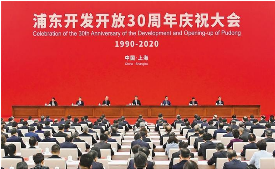
(圖 1) 浦東開發開放 30 週年慶祝大會在上海世博中心舉行，成為中國改革開放的最重要標誌之一。