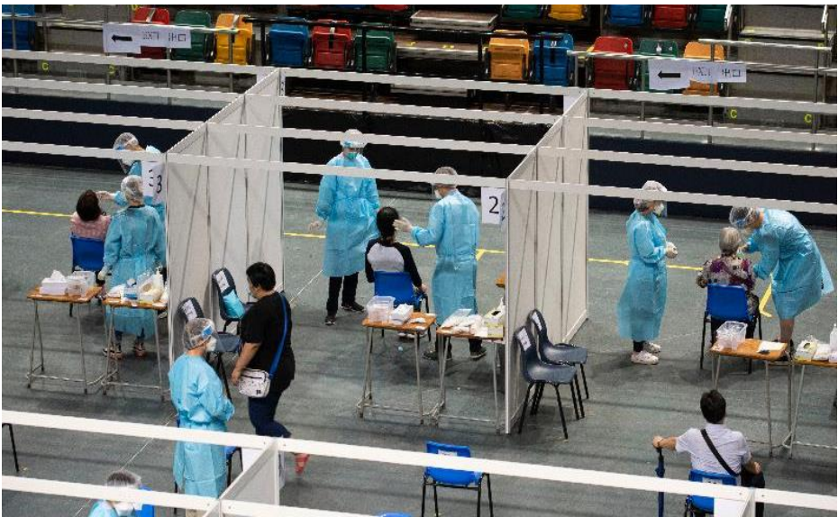
(圖 4) 香港政府推行普及社區檢測，任何市民即使沒有病徵，可免費接受新冠狀病毒檢測一次。累計逾 178 萬人參與在全港各社區檢測中心登記接受檢測。