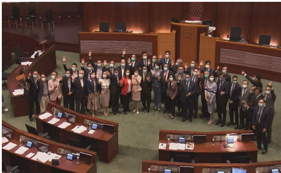
(圖 6) 第六屆香港立法會因疫情關係延任一年。人大常委會亦通過香港立法會議員資格問題的決定，民主派議員宣佈集體辭職。