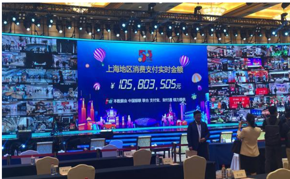
(圖 5) 上海舉辦首屆「五五購物節」，提振消費信心及釋放消費潛力，促進上海的消費市場復甦。