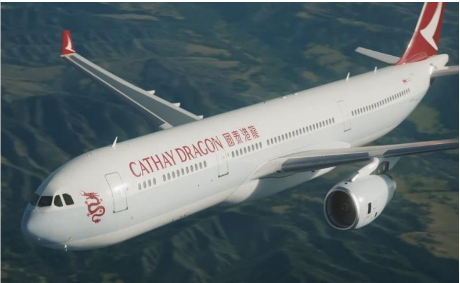
(圖 8) 全球經濟受疫情打擊，香港旅遊及航空業陷入寒冬，國泰港龍航空結束 35 年營運，航權交還特區政府，按機制分配給申請的航空公司。