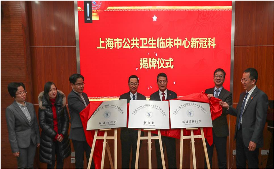
(圖 3) 為完善公共衛生醫療救治體系，全國首個新冠科在上海公衛中心正式成立，是上海市成人新冠肺炎病例唯一定點收治醫院。