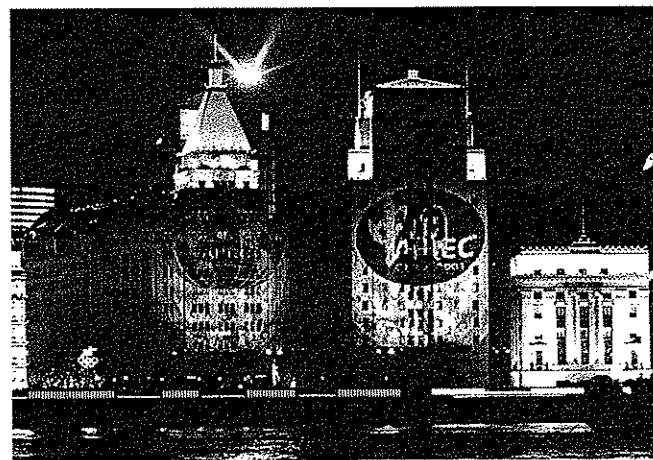
為隆重其事，上海市在APEC會議期間把市容粉飾一番。圖為浦西黃埔區外灘的萬國建築群夜景，左方的建築物為上海著名的和平飯店。