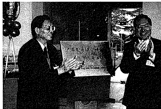
滬港發展聯合研究所的兩位理事長香港中文大學校長李國章（右）和復旦大學校長王生洪（左），2001年1月在上海主持研究所的成立典禮。