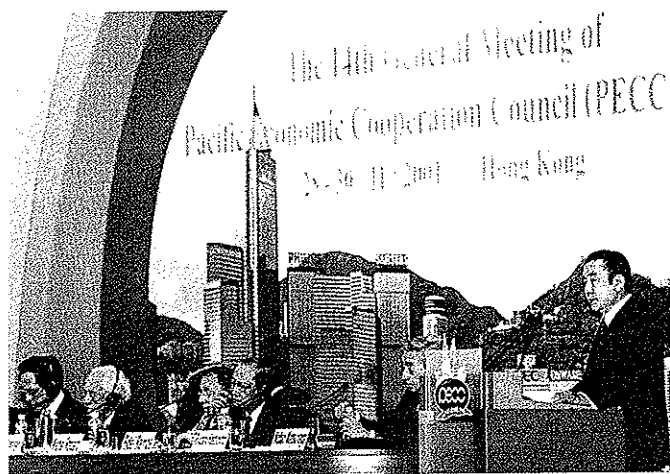
2001年11月第14屆太平洋經濟合作議會全體大會首次在香港舉行。圖為前日本首相橋本龍太郎在會上發言。